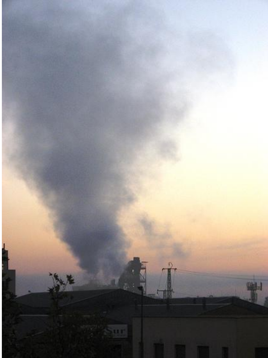
Cementera Cosmos