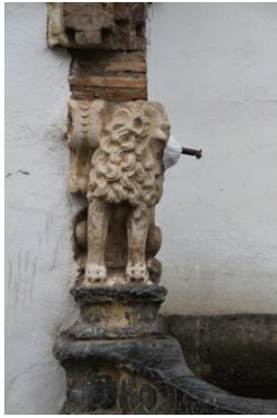
León de la Fuente de la Piedra Escrita