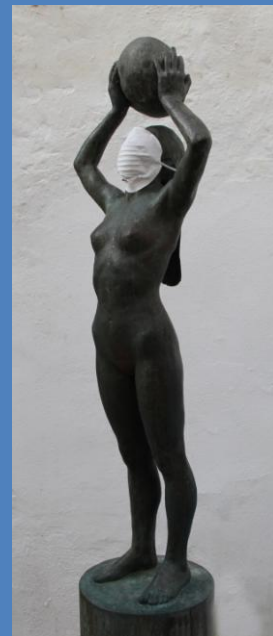
Homenaje a Ibn Suhayd

Esta iniciativa es la primera de la IVª campaña de concienciación y sensibilización ciudadana que pone en marcha la plataforma y con ella se pretende extender a toda la ciudadanía la información sobre los peligros derivados de la incineración de residuos potencialmente peligrosos en los hornos de la cementera Cosmos de Córdoba.